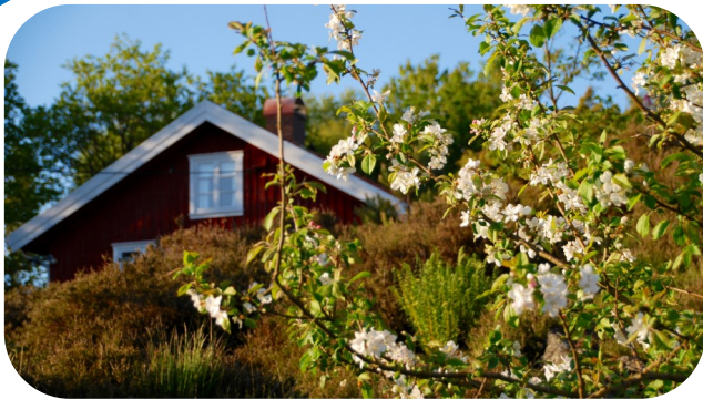
Skolmuseet om våren.