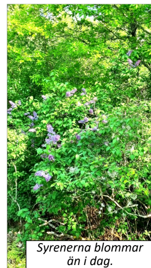
Syrenerna blommar än i dag.