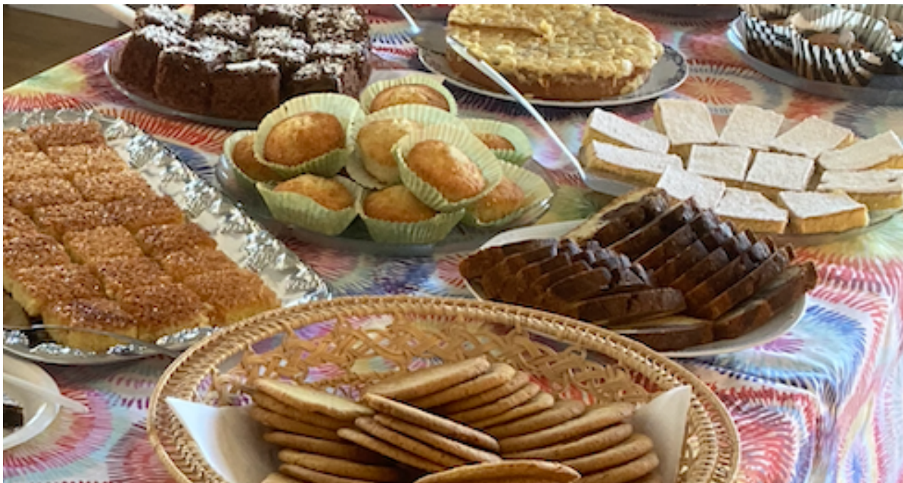
Dukat till fikastund i Flatö Skola.

I höstas blev det också fika i aktivitetsutbudet.